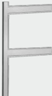
Doppia Traversa / Double Transom / Doppelsprosse