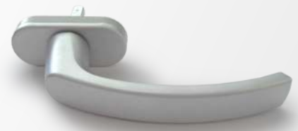
ARGENTO Argento EV1