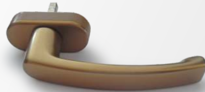
BRONZO Bronzo F4