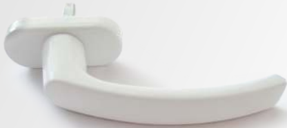
BIANCO Bianco 9010