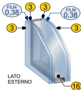
Vetro antinfortunistico (33.1/ 16 gas argon /33.1) selettivo con canalino warm edge