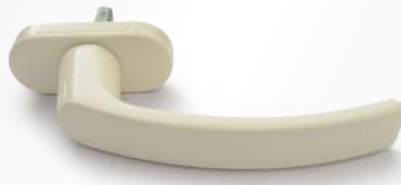
AVORIO Avorio 1013