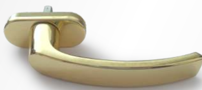
OTTONE Ottone lucido