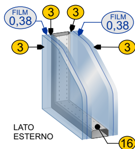
Vetro antinfortunistico (33.1/ 16 /33.1) selettivo