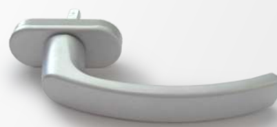
ARGENTO Argento EV1