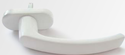
BIANCO Bianco 9010