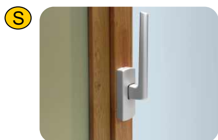
Apertura scorrevole parallelo colori: argento, oro opaco, bianco 9010, bianco 1013, marrone.