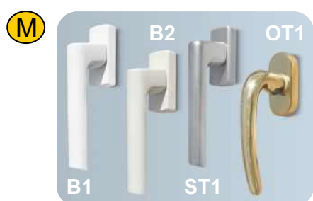
Apertura a battente